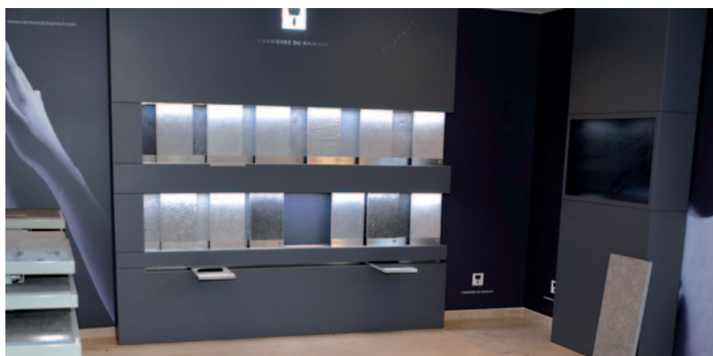
Zicht op de nieuwe toonzaal, die in 2020 ingericht werd.