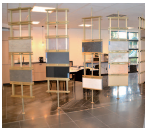
Vues du nouveau show-room aménagé depuis 2020.